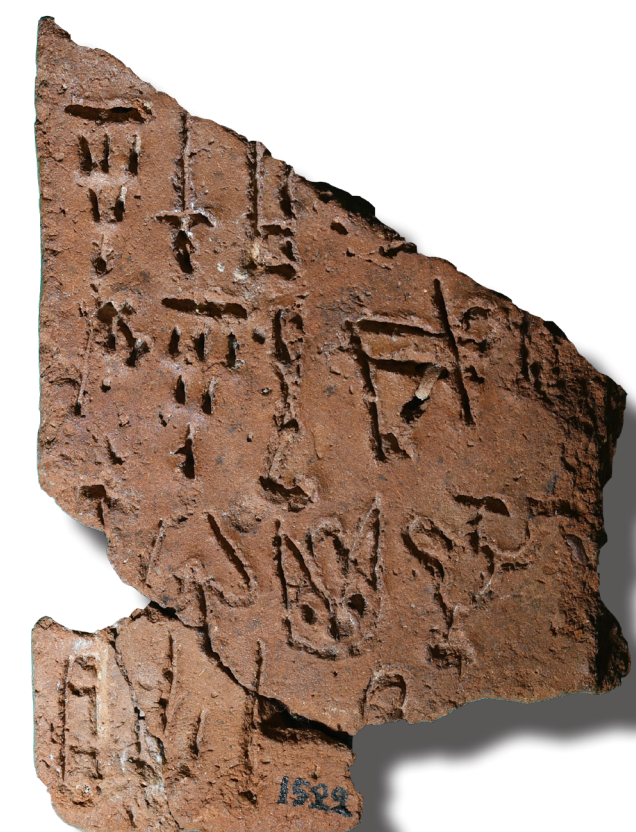
La tavoletta PH 7 di Festòs.

A questo si aggiungono anche altri intenti: per esempio, la documentazione digitale originale completa sarà fornita al Museo Archeologico di Heraklion affinché possa essere impiegata all'interno di percorsi interattivi per i visitatori, oltre a offrire una modalità per preservare e conservare questi antichi documenti. Inoltre, le immagini RTI ad alta definizione saranno caricate sulla pagina web del The Linear B pa-i-to Epigraphic Project , in aggiunta ai documenti in Lineare B su Festòs già presenti, così da essere fruibili e accessibili a tutti ( https://www.paitoproject.it/ ).